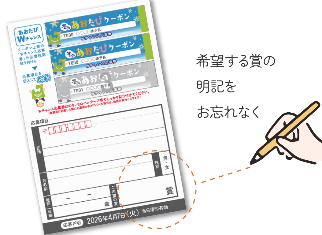
希望する賞の 明記を お忘れなく