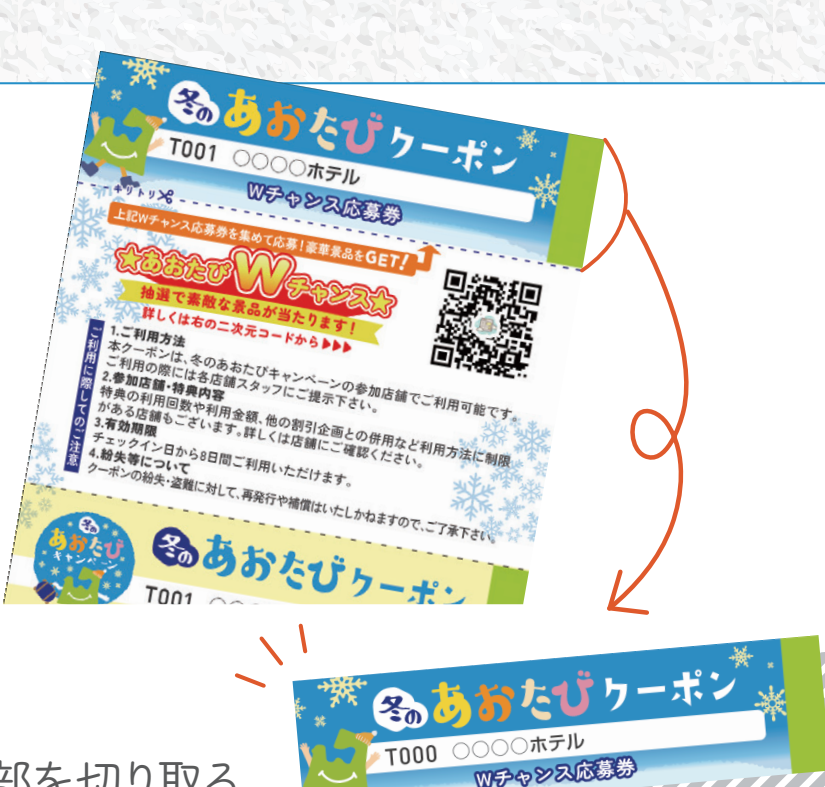
クーポン上部を切り取る

対象宿泊施設で配布される「冬のあおたびクーポン」 の上部についている応募券を集めます。